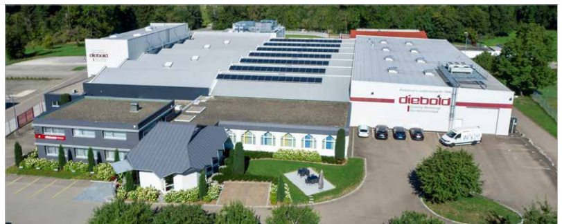
Firma Diebold "Die klimaneutrale Fabrik"

Fordern Sie uns heraus und senden Sie uns Ihre Anfrage an: info@hsk.com oder rufen Sie an unter: +49 7477 871-0